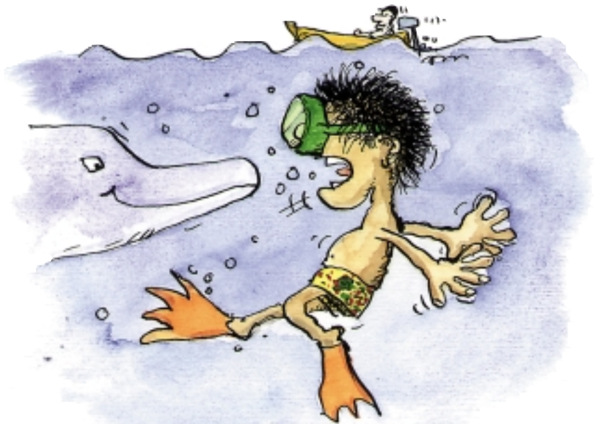
Francesco schwimmt im Mittelmeer.